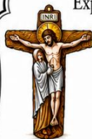
Cruz de la Unidad